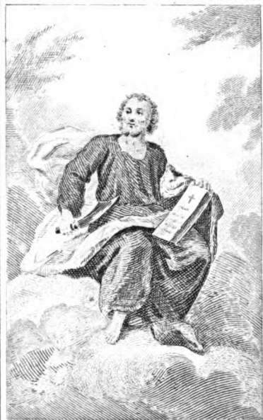
SAN BARTOLOMÉ, Cree en el Espíritu Santo.